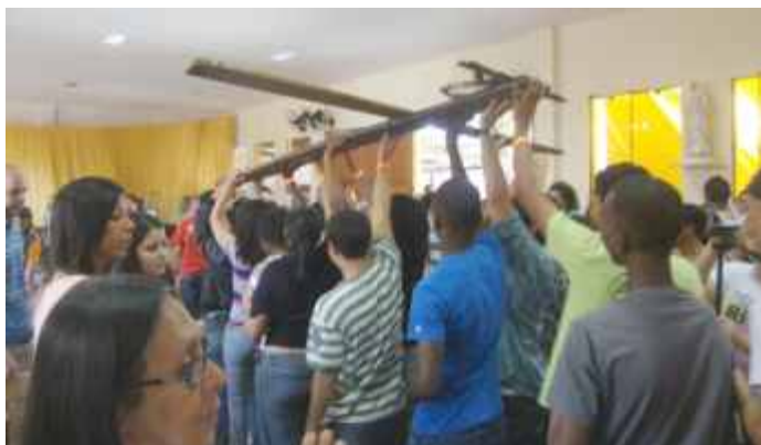
Jovens em procissão com a cruz