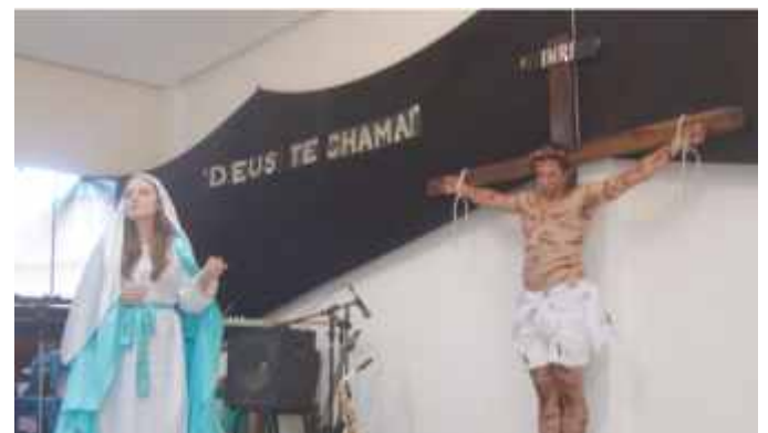
Encenação sobre o chamado de Deus