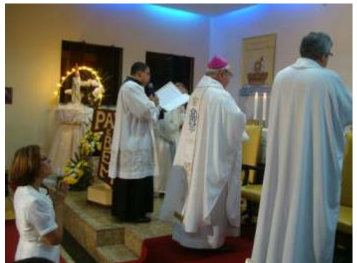
Ladainha de todos os santos