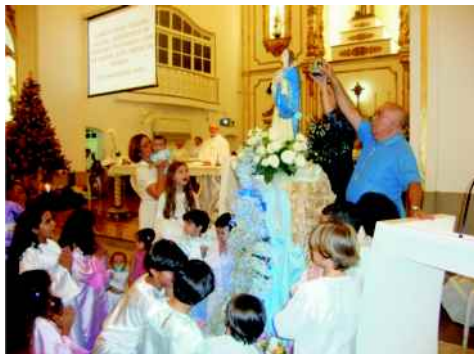
Coroação de Nossa Senhora