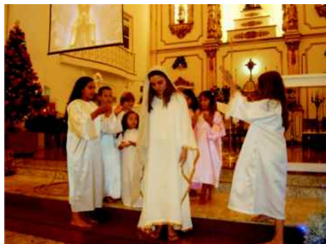
Encenação das alegrias de Nossa Senhora (assunção aos céus)

as sete alegrias de Nossa Senhora: Anunciação do Anjo, visita a Isabel, nascimento de Jesus, adoração dos Reis Magos, encontro no templo, encontro com Jesus Ressuscitado e coroação e assunção de Maria. Em seguida foi realizada uma pequena confraternização no salão paroquial.