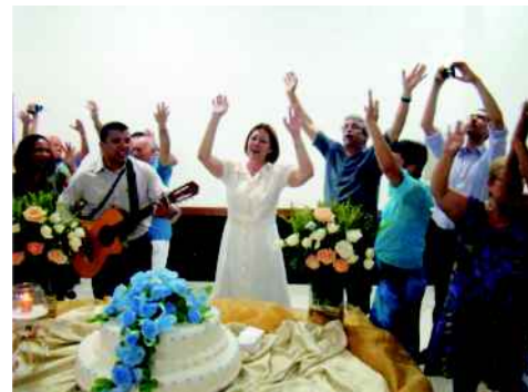
Confraternização após a missa