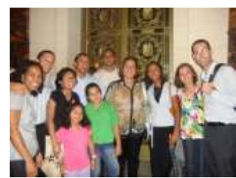
Membros da comunidade presentes ao evento