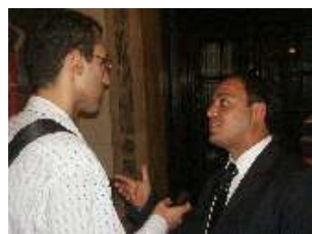
Entrevista com o deputado Rodrigo Neves