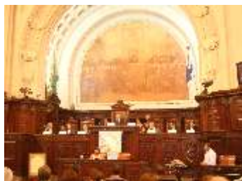
Autoridades presentes à sessão